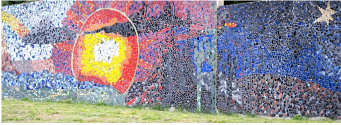
Mosaikwand im Kloster

Leise tritt es über deine Schwelle das Licht, blüht die Farben einer neuen Zeit auf die Wände, verwandelt den Staub deiner Tage zu Gold mit seinem leichten Schritt und legt um deine Ängste, deine Zweifel warm seinen Mantel: Fürchte dich nicht!